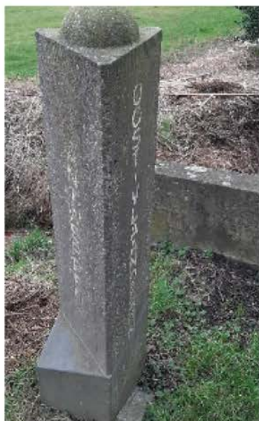
3-provinciënmonument ter hoogte van knooppunt 92