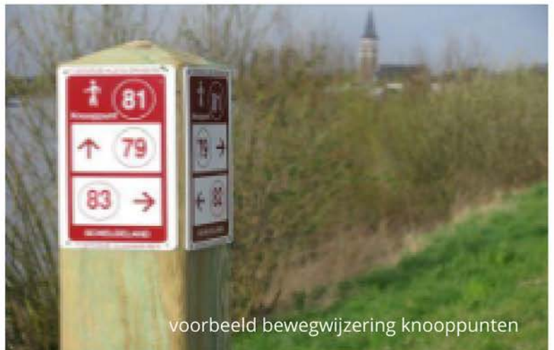
voorbeeld bewegwijzering knooppunten

De zoektocht is bewegwijzerd met wandelknooppunten (zie voorbeeld hiernaast). Om alle foto's te vinden volg je de knooppuntnummers die we je hierna meegeven. Starten doe je aan knooppunt 3 (Wandelnetwerk Vlaams-Brabants Brabantse Kouters).