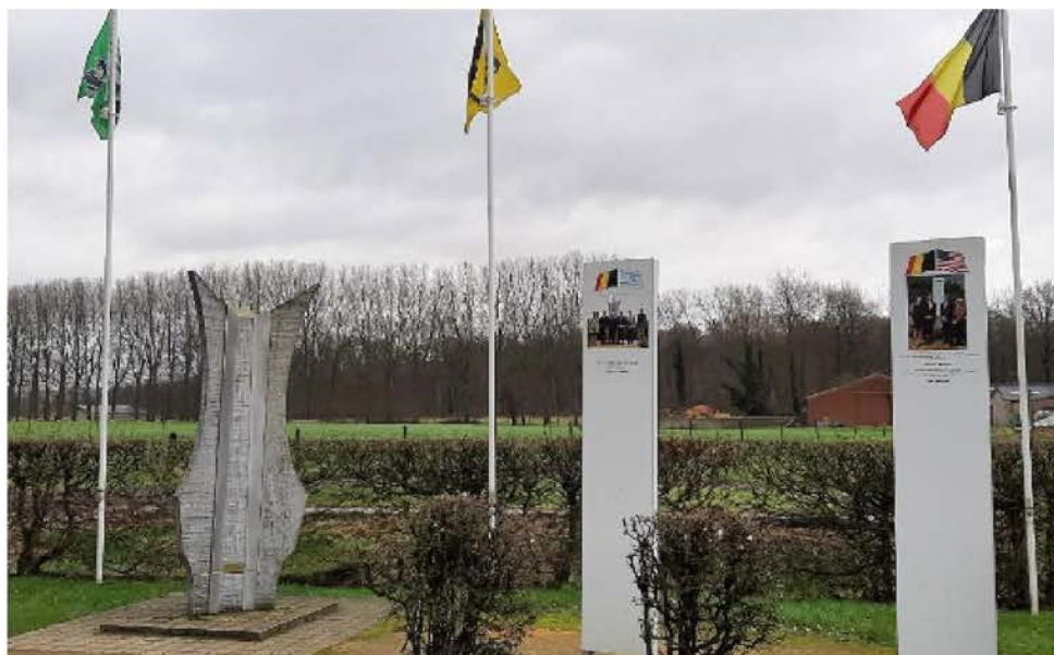
Even voorbij knooppunt 92 vind je het geografisch middelpunt van Vlaanderen